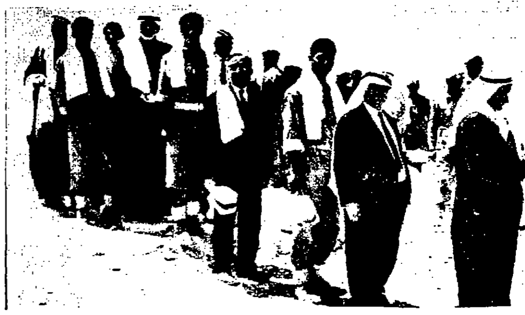
السيد صيف الله الحمود محافظ العاصمة ينظر دوره لتناول غذائه فيطاور الكائن بالخدمة الوطنية

تعلن رئاسة اركان الجيش العربي - مديرية الخدمات الطبية الملكية عن امتحان باب التسجيل في مدرسة تلميذات مساعدات التمريض بالمستشفى الرئيسي . مدة الدراسة ١٨ شهرا وتعين الطالبة براتب ورفقة جندی نظمي وتؤمن باللباس والسكن وعند التخرج بنجاح تعطى علاوة شهرية ثلاثة فئات . شروط القبول : ١ - ان لا يقل سنها عن ١٧ عاما ولا يزيد عن ٢٥ ٢ - ان تكون قد انتهت لصفها الثالث اعدادي بنجاح . ٣ - ان تكون اردنية الجنسية . على الراغبات بالانقباض مواجحة مديرية التمريض في مديرية الخدمات الطبية الملكية أيام السبت - والثلاثاء - والاربعاء ما بين الساعة ٩٠٠ - ١٢٠٠ مستصحات مهن الشهادة المدرسية ، شهادة الميلاد ، جواز السفر . محكمة حقوق صلح عمان